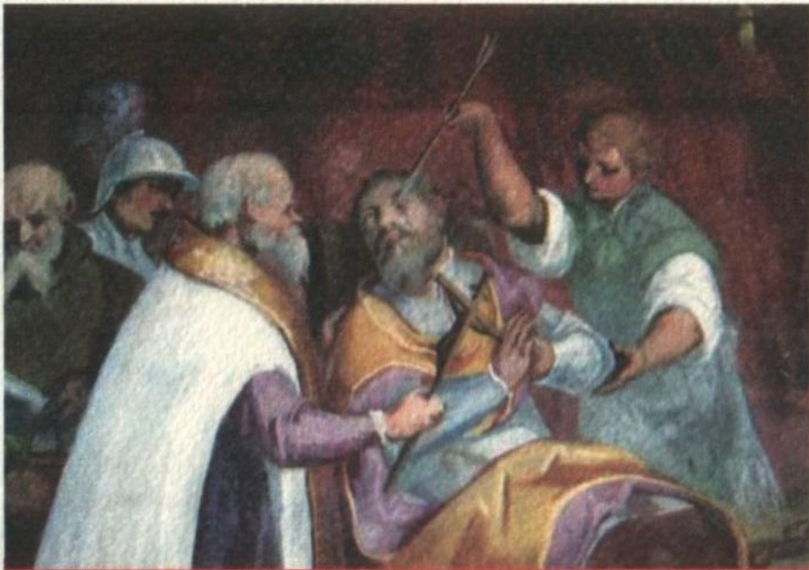
La morte di Agostino Barbarigo - Villa Barbarigo - Noventa Vicentina